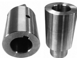
Adapter - armatureseitig bearbeitet

Die Adapterrohlinge sind antriebsseitig fertig bearbeitet und die armatureseitige Bearbeitung folgt auf Kundenwunsch.